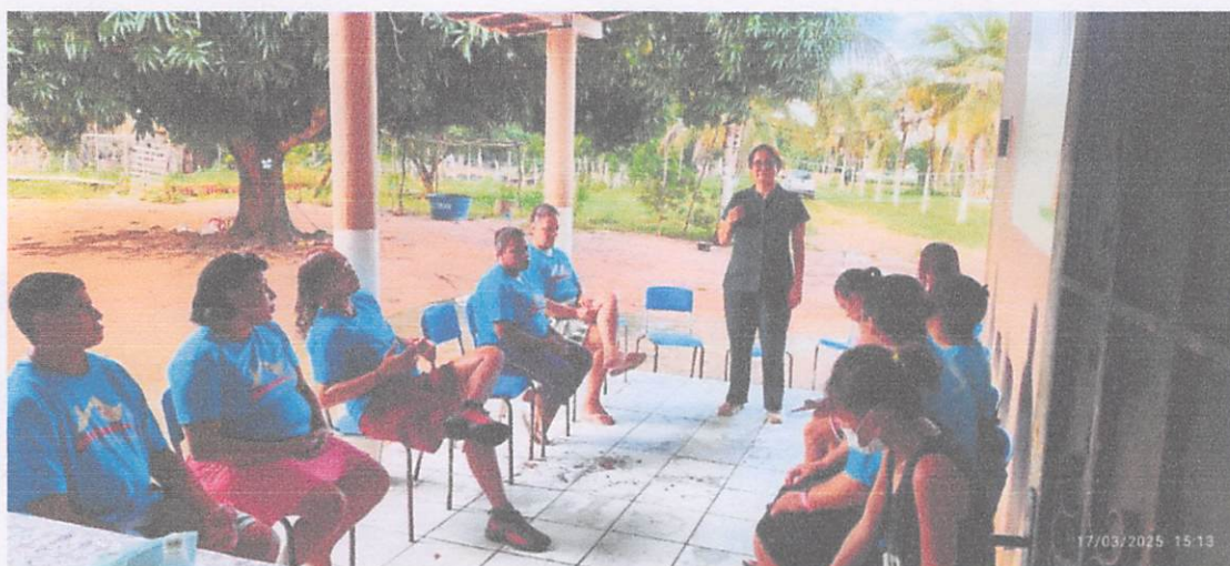
GRUPO DE MULHERES DO SINDICATO DOS SERVIDORES PÚBLICOS - EQUILÍBRIO EMOCIONAL