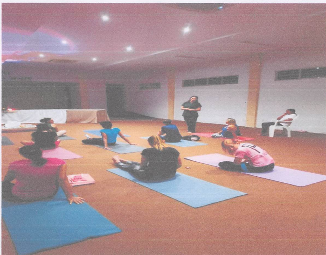
Eventos culturais e troca de experiências.