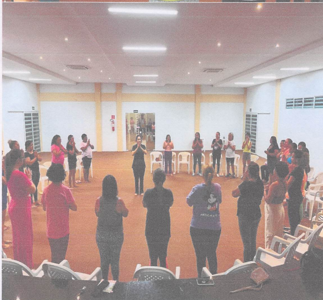
PRÁTICAS INTEGRATIVAS COMPLEMENTARES EM SAÚDE MENTAL COM GRUPO DE MULHERES