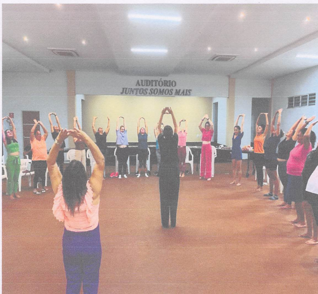
GRUPO DE MULHERES DO SINDICATO DOS SERVIDORES PÚBLICOS - SAÚDE MENTAL E DIREITOS DAS MULHERES