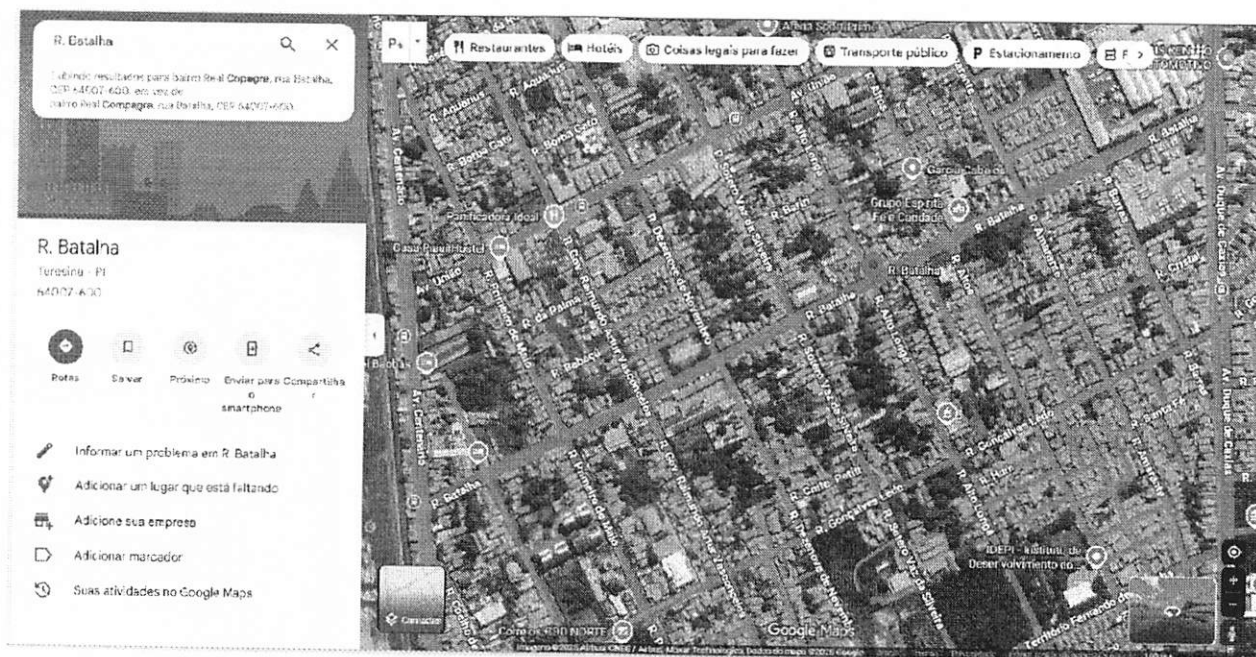
Figura 1: Mapa de localização da via que se solicita a inserção de linha de ônibus, situada no bairro Real Copagre, rua Batalha, CEP 64007-600.