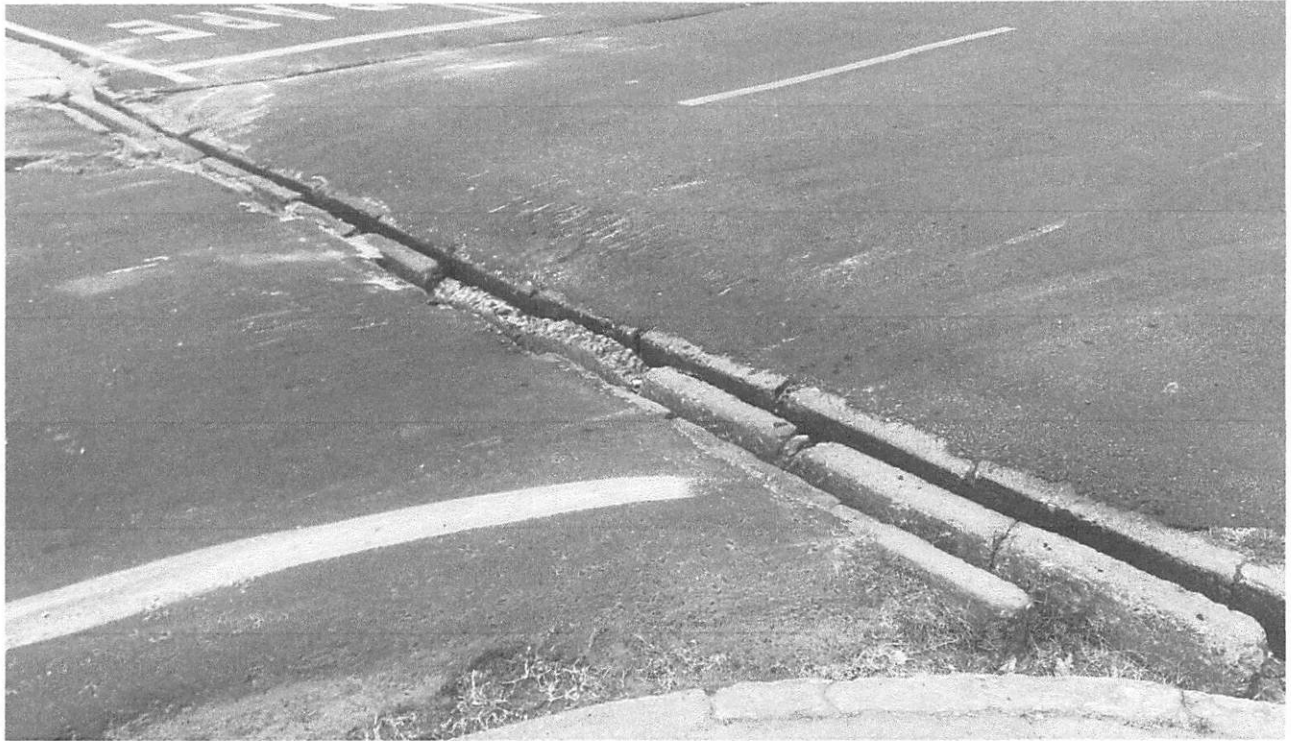
Figura 2: Trecho danificado na interseção das ruas José Ommate e Acre, no bairro Cabral, necessitando de reestruturação do pavimento para garantir segurança e melhor fluxo de veículos.