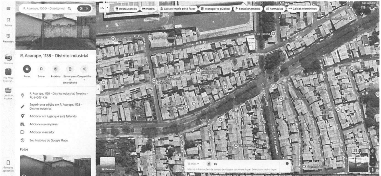
Figura 1: Mapa de localização da rua Acarape, número 1000 - 1168, bairro Distrito Industrial, CEP 64027-426.

PALÁCIO SENADOR CHAGAS RODRIGUES CÂMARA MUNICIPAL DE TERESINA Av. Marechal Castelo Branco, 625 - Cabral CEP: 64000-810 • Teresina/PI Telefone: (86) 3200-0350