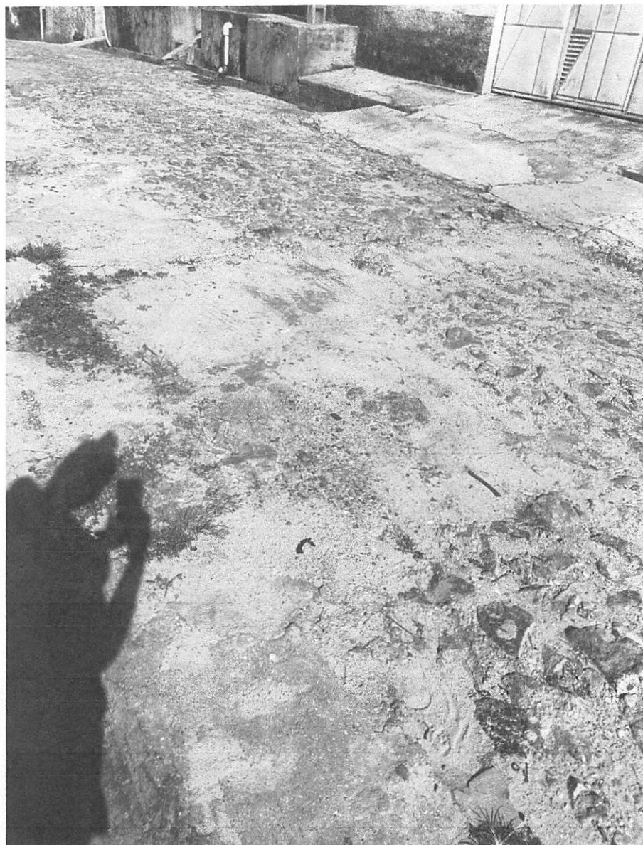
Figura 3: Imagem que comprova as condições da via pública, com desníveis, comprometendo a mobilidade, a segurança e a qualidade de vida da comunidade local.

PALÁCIO SENADOR CHAGAS RODRIGUES CÂMARA MUNICIPAL DE TERESINA Av. Marechal Castelo Branco, 625 - Cabral CEP: 64000-810 • Teresina/PI Telefone: (86) 3200-0350