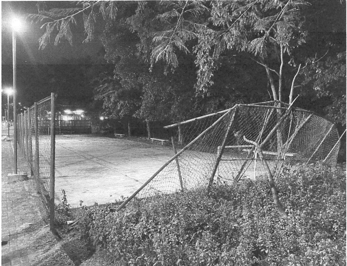
Figura 2: A quadra encontra-se em estado de degradação, com acúmulo de lixo, o que compromete sua funcionalidade e contribui para um aspecto visual negativo na cidade. Além de impactar a estética urbana, essa situação gera transtornos para a população, tornando o ambiente inadequado para atividades esportivas e de lazer.