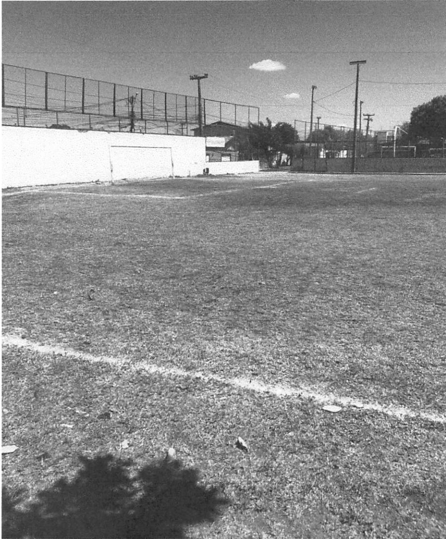
Figura 2: A comunidade da região solicita a revitalização do espaço, visando uma melhor utilização pela população local.