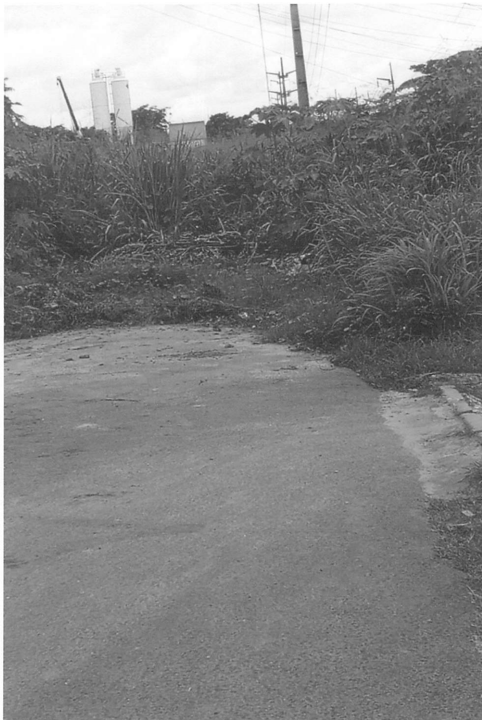
Figura 2: A ausência de pavimentação tem gerado diversos transtornos, especialmente em períodos chuvosos. Dessa forma, solicita-se a execução de pavimentação asfáltica para garantir melhores condições de acesso e qualidade de vida à população.