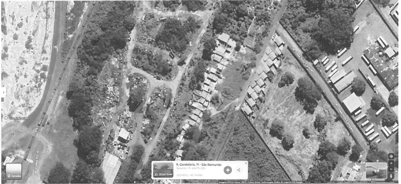
Figura 1: Mapa de localização da área que se solicita pavimentação asfáltica, da rua Candelário, Vila São Raimundo, CEP 64075-025.

PALÁCIO SENADOR CHAGAS RODRIGUES CÂMARA MUNICIPAL DE TERESINA Av. Marechal Castelo Branco, 625 - Cabral CEP: 64000-810 • Teresina/PI