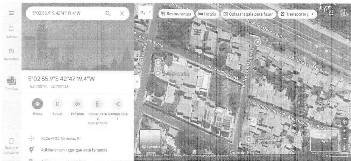
Figura 1: Mapa de localização da via que se solicita a limpeza de galeria, situada na rua Nelson Mandela, número 1116, bairro Ininga, CEP 64048-450.