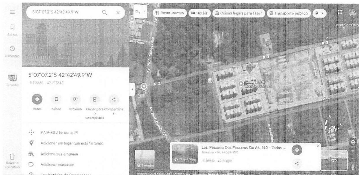
Figura : Mapa de localização da via que se solicita a capina e limpeza, situada no Loteamento Recanto Dos Pássaros, Quadra A1, número 140, bairro Bom Princípio.

PALÁCIO SENADOR CHAGAS RODRIGUES CÂMARA MUNICIPAL DE TERESINA Av. Marechal Castelo Branco, 625 - Cabral CEP: 64000-810 • Teresina Telefone: (86) 3200-0350