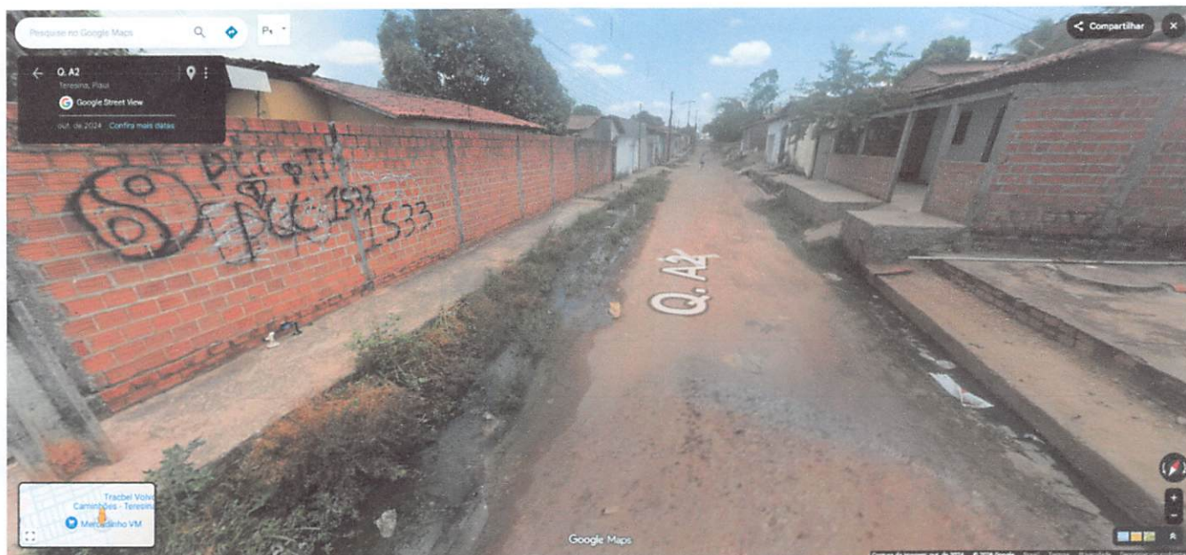
Figura 2: A via apresenta condições precárias de trafegabilidade, com lama, irregularidades no leito carroçável e esgoto a céu aberto, comprometendo a mobilidade e a saúde pública, sobretudo no período chuvoso.