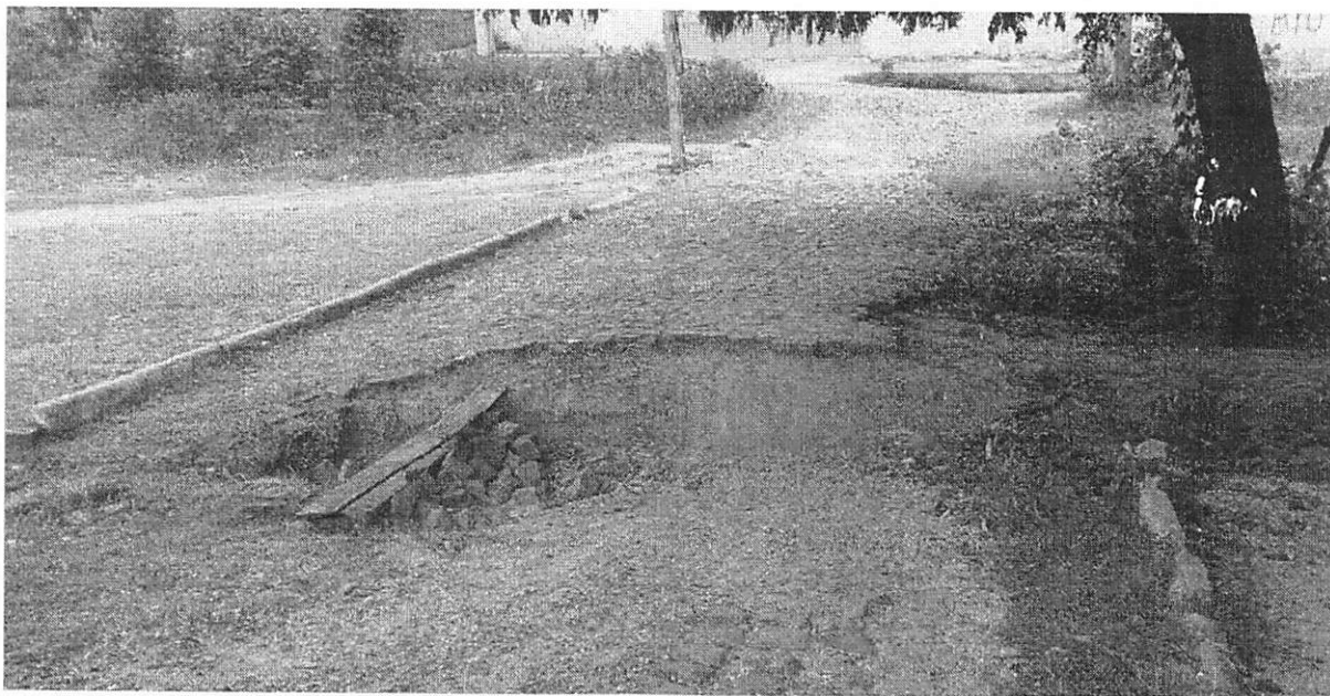
Figura 2: Registro fotográfico da atual situação da via, que apresenta danos estruturais, causando diversos transtornos à comunidade e aos transeuntes.