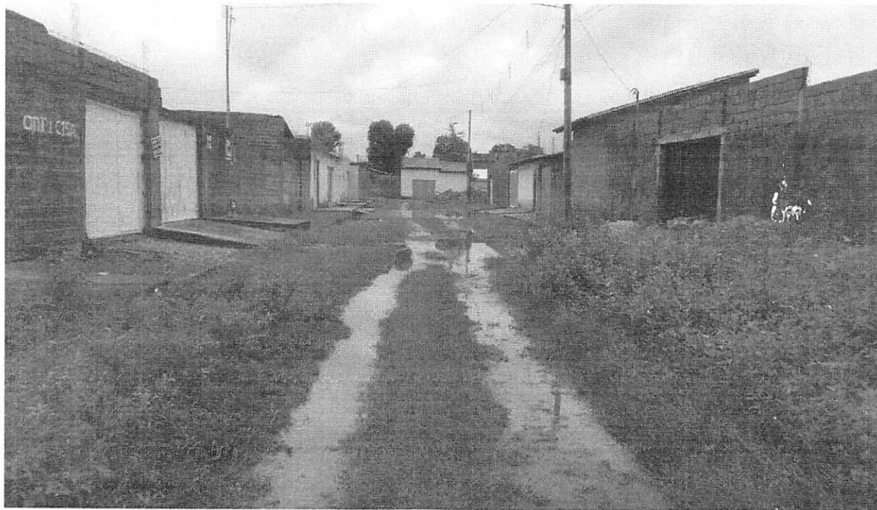
Figura 2: A rua se encontra em situação degradante devido ao acúmulo de vegetação e resíduos sólidos. Essa condição tem causado diversos transtornos à comunidade local, comprometendo a qualidade de vida dos moradores e podendo representar riscos à saúde pública