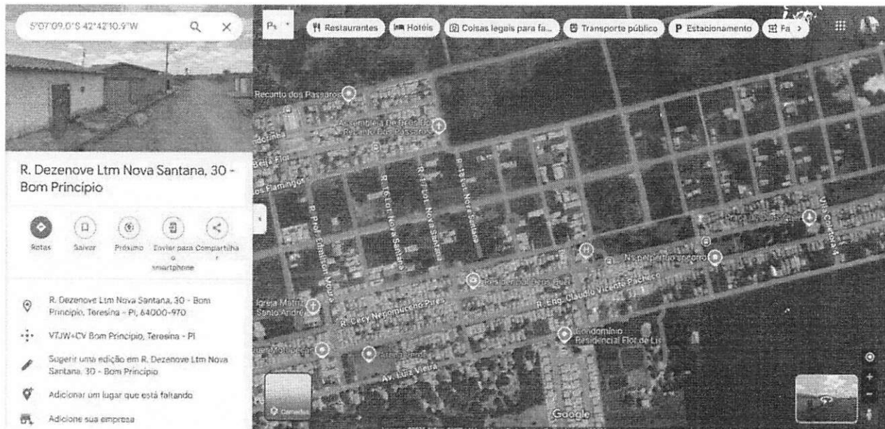
Figura 1: Mapa de localização da via que solicita-se a pavimentação, situada no bairro Bom Princípio, rua Dezenove número 30, loteamento Nova Santana.