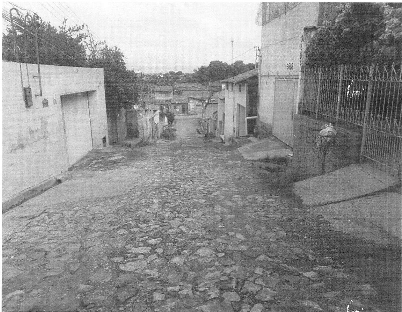
Figura 3: A atual condição da via pública com excesso de vegetação avançando sobre o caminho e solo irregular, ocasionando transtornos no deslocamento e limitando o tráfego no local.