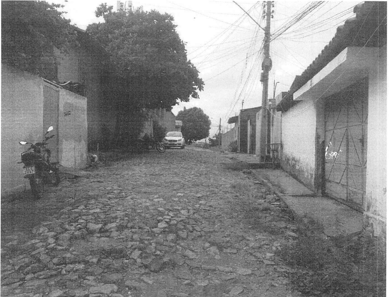
Figura 2: Registro fotográfico das condições atuais da via, com presença de vegetação elevada e irregularidades no acesso.